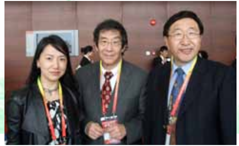
世博高峰學術論壇嘉賓講員、《文化中國》學刊顧問著名學者杜維明(中)、筆者(左)、梁燕城博士(右)攝於世博

世界最早的城市，可一直追溯至西元前 5400 年，位處米索不達米亞的埃里多 (Eridu) 城。在人類七千多年來的城市規劃與建設中，社區的建設與發展形成了不同的文化，同時也面對和解因而產生出來的問題。直到二十一世紀的今天，如何正確地、有效地促進都市文化的建設和發展，都是極為重要的課題。有見及此，文化更新研究中心與國內學府代表籌劃「都市發展與文化保存」國際論壇，透過學術活動表達關注和適切的回應。