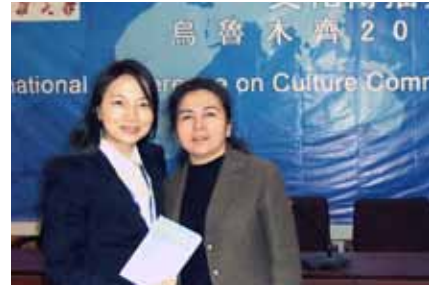
維吾爾族阿斯買教授與筆者交流並送上研究著作