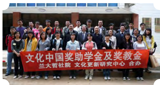
第一期文化中國獎助學金受助師生和捐助人