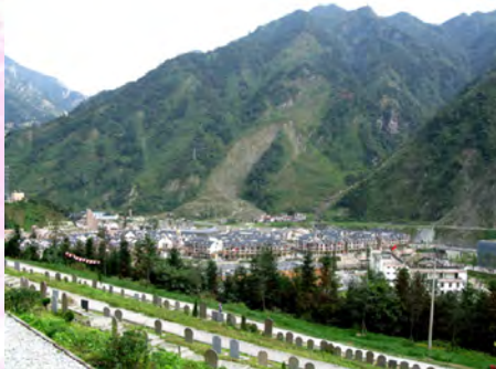
震後重建的鄉村新貌，近處為地震遇難者公墓

嘉賓們都向三年培訓課程內參加的老師、校長及教練們致謝，大家的觀點互相碰撞，流露關愛，感恩前行。在過去的三年，雖然我並未有參與其中，只是結題時出現，但房內近百人的溫馨氣氛，令人不難感受！