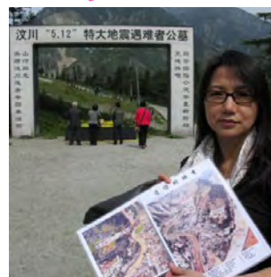
筆者手持當地售賣的震災前後對比相片畫冊