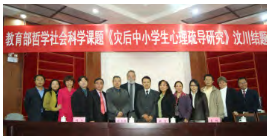
汶川縣及成都市中小學心理骨幹教師培訓結業禮