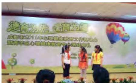
心理健康教育中心成立揭幕典禮