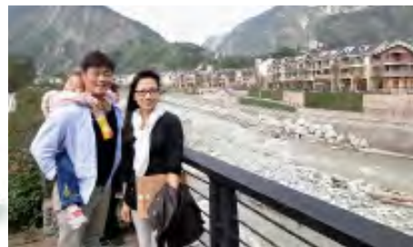
震後山河遺貌及民房重建新貌