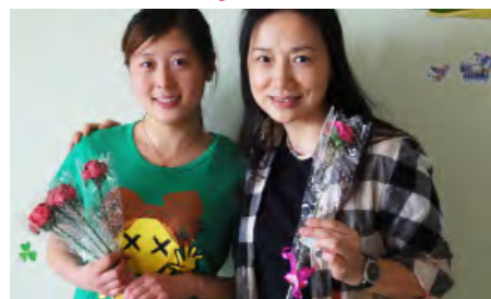
「媽媽之花」是媽媽之家的手工藝課程之一