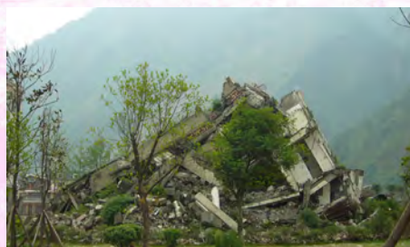
地震遺址帶來啟醒，文更看到心靈重建的任務