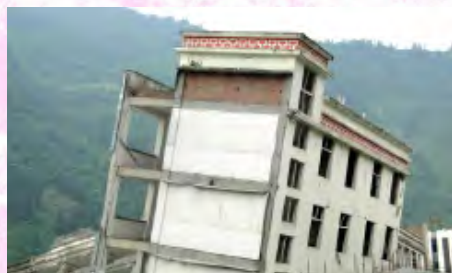
昔日地震倒塌定格，令你聯想起意大利斜塔嗎？

在共同生活的五天裡，來自美國和香港的我們一起關心他人，亦互相關顧；我們活潑地為前線人員打氣，亦莊嚴地悼念死難者；我們一同跨文化越幽谷，不分董事同工義工支持者，只想真誠地把好事做好，發放關愛精神，溫暖被訪的各人。